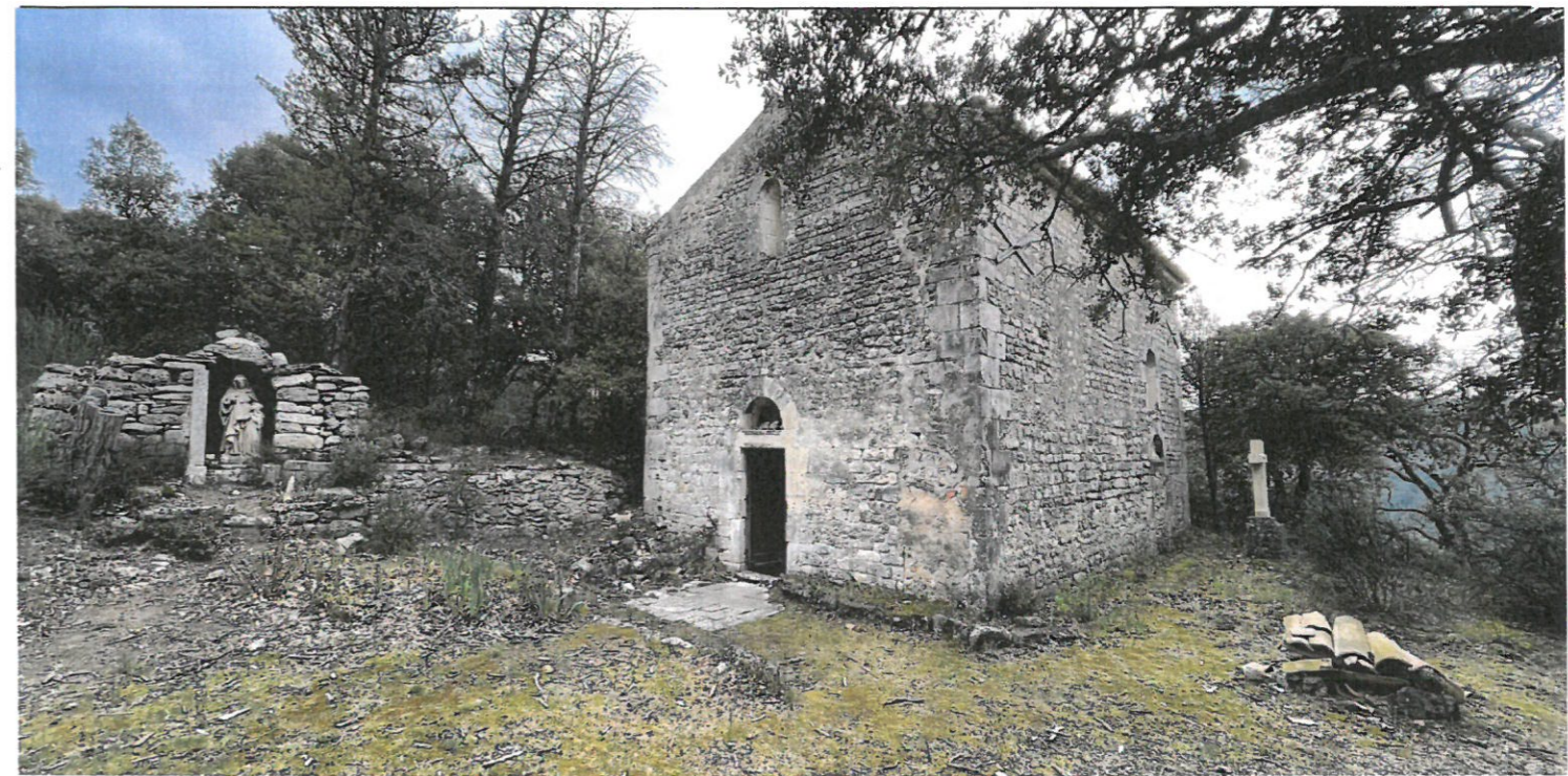
Chapelle de Toronne