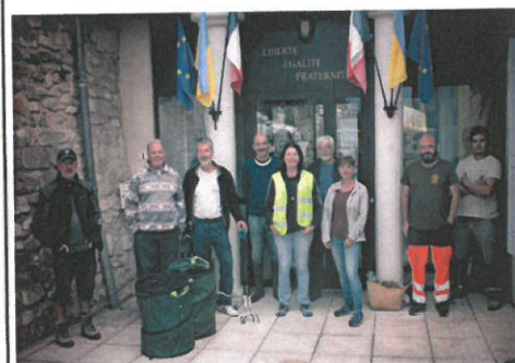
Les premiers volontaires

mière fois, l'opération a été éten- due aux chemins pédestres et ru- raux.