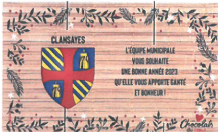
Boîte souvenir au couleurs de la Commune

Comme chaque année en cette période de fêtes, les Elus du CCAS se rendent chez les Clansayais de plus de 80 ans pour leur offrir une boîte de chocolats.