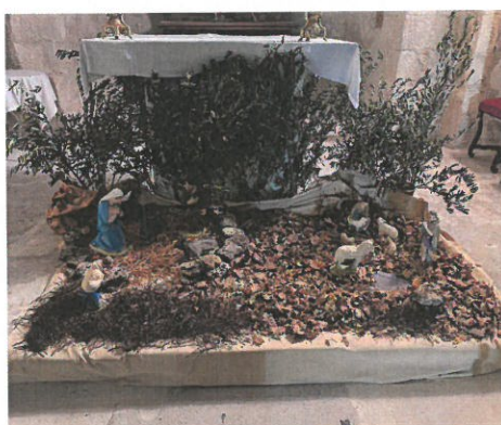
La crèche visible dans l'église