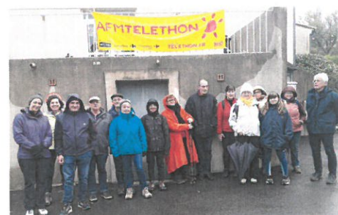
Les courageux marcheurs pour une belle œuvre

L'association va reverser la somme de 550 euros au téléthon.