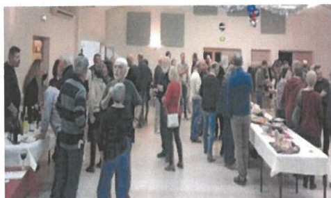
Les Clansayais ont répondu présents

S'enchaîne l'évènement plus terrestre du divin Bacchus, lors du 02 Décembre, qui mettait à l'honneur cette fois nos viticul-teurs locaux : rouge, rosé, blanc et pétillant pouvaient être dégus-tés (avec modération bien sûr...).