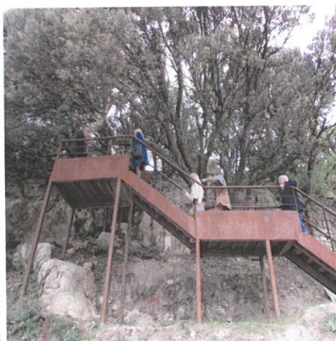
Le nouvel escalier en acier Corten

Ce projet engagé par la pré- cédente équipe municipale a été finalisé après plusieurs réunions avec les habitants et les associa- tions. Un des objectifs de ce projet était de pouvoir accéder au cœur du village par des escaliers.