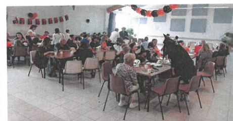
Travail avec les grands-parents

Au programme chasse aux bonbons, atelier maquillage, goû- ter .