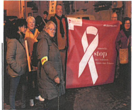
M le Maire et la Première Adjointe ont participé à cette manifestation

Le 3919 constitue le numéro national de référence pour les femmes victimes de violences. Ce numéro est gratuit, ouvert 24h/24 et 7j/7.