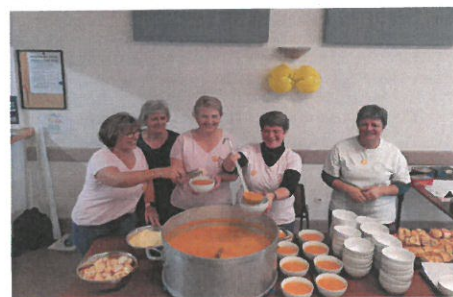
Le travail dans la joie...

L'Association Dynamic Gym a été à l'origine d'une belle initiative solidaire en organisant le Téléthon.