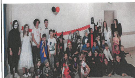
Les jeunes....monstres ?

Halloween s'était installé dans la commune le temps d'une après-midi ensoleillée. Nombreux petits et grands Clansayais étaient déguisés pour fêter l'évènement.