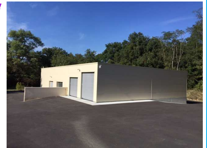
Route du Village

Un vin d'honneur sera servi à l'issue de la cérémonie.