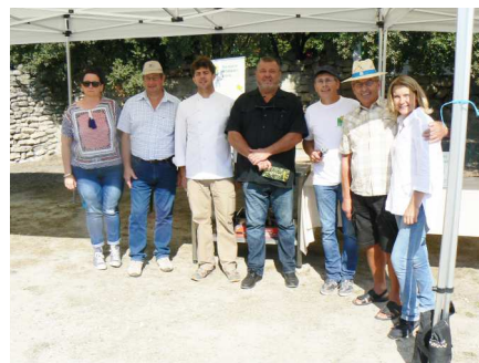
Les membres de la chambre d'agriculture et les élus.

Tous les ingrédients étaient réunis avec un bien grand marché de producteurs (salaisons, fromages, vins, bières et confiserie, huiles essentielles et produits de beauté, plantes aromatiques, ateliers culinaires et artisanaux...) pour permettre à de nombreux visiteurs de profiter d'un moment exceptionnel à l'occasion de l'opération « Savourez une journée à la ferme ». Proposée par la chambre d'agriculture et l'association Bienvenue à la ferme en Drôme, elle était accueillie au domaine de l'Essentiel de Lavande sur le plateau de Clansayes.