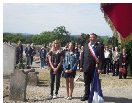
Virginie et Rosa avec Monsieur le Maire

Le 71ème anniversaire de la capitulation de l'Allemagne nazie le 8 mai 1945 a été commémoré en présence de Monsieur le Maire, des conseillers municipaux, des Clansayais, des associations patriotiques et d'une délégation des sapeurs-pompiers. L'Harmonie de la Lyre de St Paul a accompagné musicalement cet hommage.