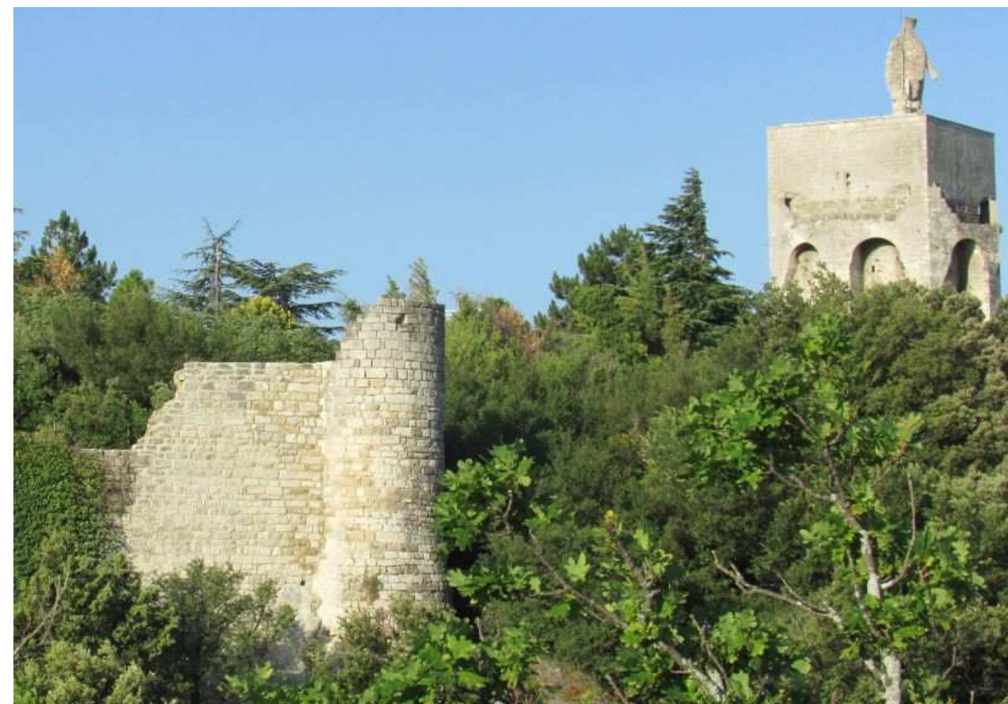
La tour ronde après les travaux de protection