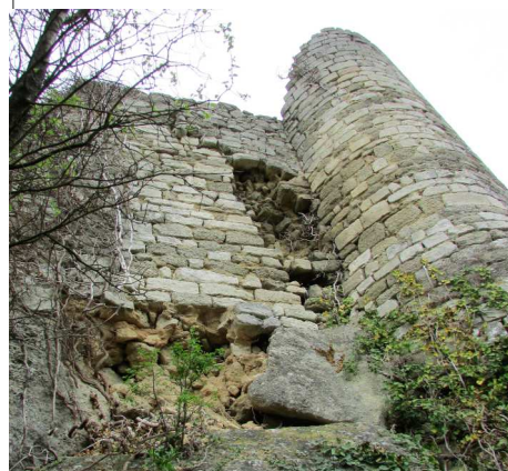
La tour ronde avant les travaux .

Merci à VAC association de sauvegarde du patrimoine et Mémoire de la Drôme qui les ont financés.